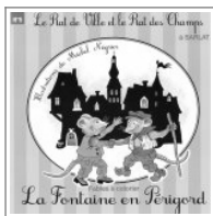
Fables de La Fontaine en Périgord