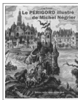
Le Périgord Illustré